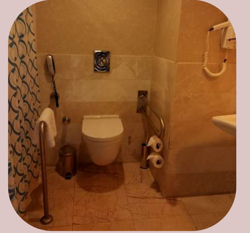
Engelli odası tuvalet