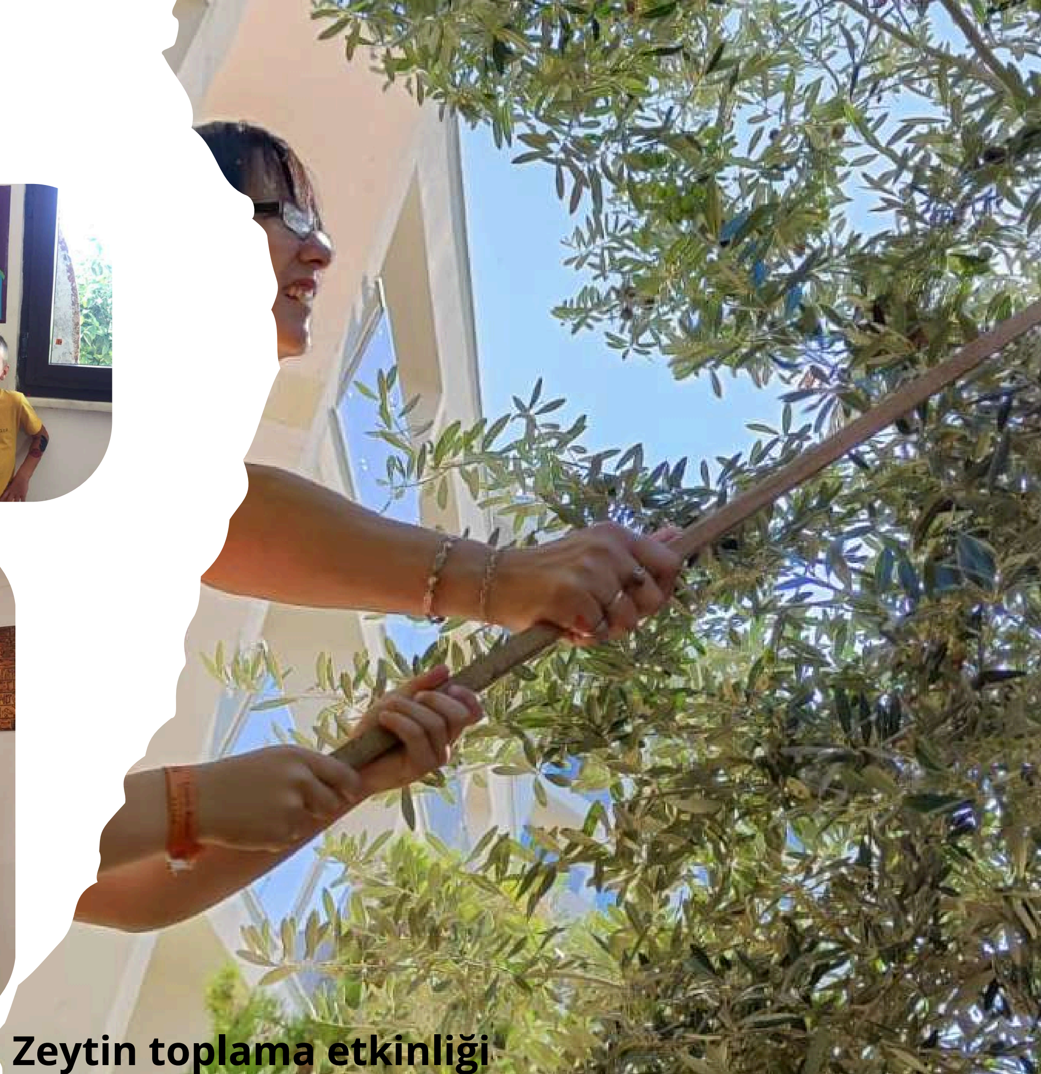
Zeytin toplama etkinliđi