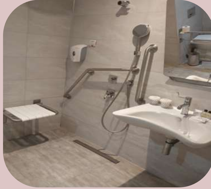
Engelli odası banyosu